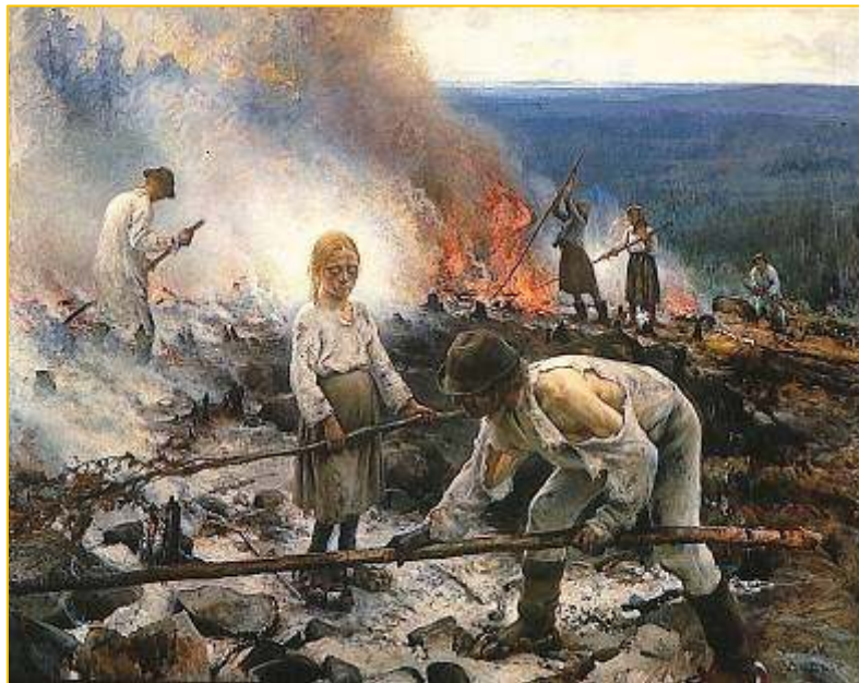
Eero Järnefelt 1893, Ateneum